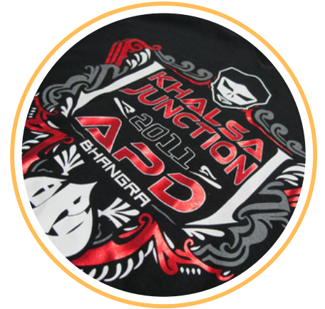
DTF / PLASTISOL